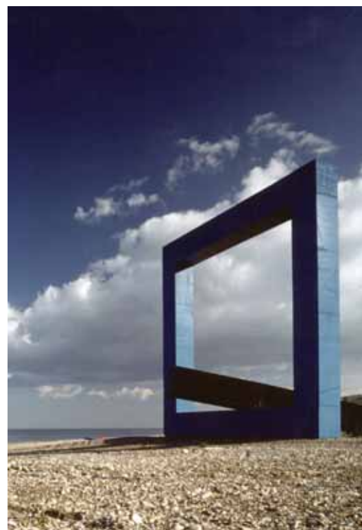
Монумент на смерть поэта.

ев, неровный волнообразный вход, наводил на ассоциации с горной пещерой, сквозь узкие прорезы вместо окон сочился тусклый свет. Мы оказались внутри какой-то мрачной Йеменской постройки из фильма великого режиссера «Цветок 1001 ночи». Вверху по квадрату стен написана цитата на арабском языке из поэмы Пазолини «Моему народу». Спать в этой комнате было не просто жутко, но, наверное, и невозможно. Спасли сумасшедшая усталость и добрый глоток вина. Утро полностью перевернуло пространство комнаты и погрузило сознание в новые аллюзии и смыслы. Огромное во всю стену окно тут же напомнило киноэкран, на котором из темно-синего моря вставало оранжево-красное солнце, освещая скалу-утес, энергетика которого, безусловно, напоминала характер режиссера Пазолини. Под широким стеклянным подоконником, как продолжение пляжа лежал песок со странными следами-пиктограммами. Душ в этом номере, разумеется, тоже был совершенно экзотическим. Собственно это был и не душ, а небольшая авто-мойка! И это могло бы показаться странным тому, кто не знает историю смерти Паоло Пазолини. Дело