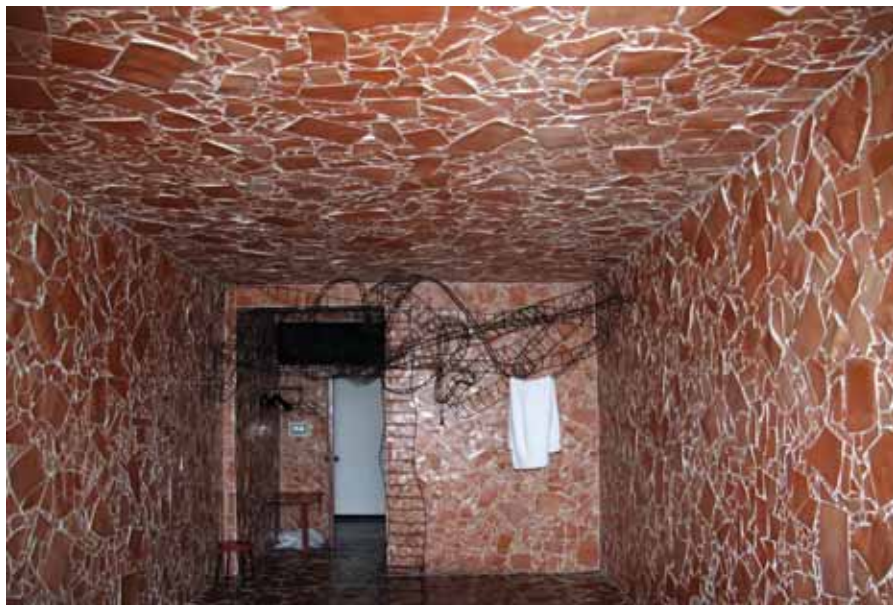
Комната «Земли и огня».

магической книге Просперо. А кровать, стоящая на одной ножке, чуть ли не парит перед огромным окном. Из мебели в комнате только один металлический стул, спинка, которого, закручиваясь словно дым, уходит под потолок.