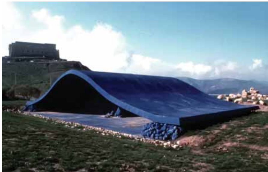
Скульптура «Энергия Средиземно- рья».

К огда, поэт и художник Эвелина Шац предложила мне погостить у миллионера, мецената и художника Антонио Прести в его арт-отеле «Ателье сул маре» на побережье Сицилии в маленьком поселке Кастель ди Туза, я не очень понимал, куда и зачем я еду. Оказалось, стоило!